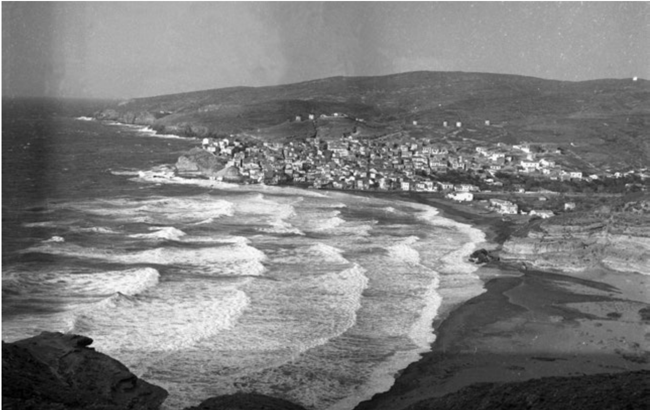
Η παραλία του Αη-Στράτη.