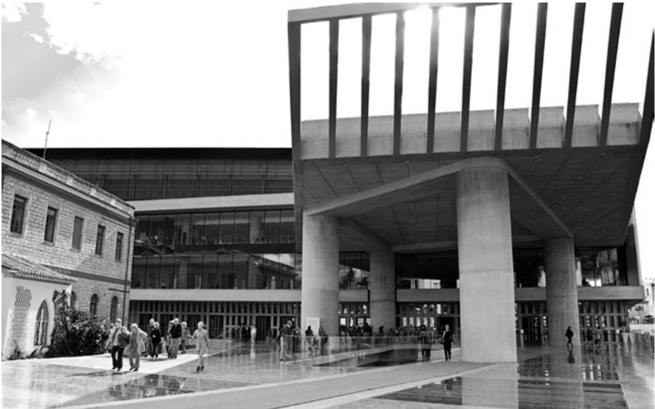
Η είσοδος του Νέου Μουσείου της Ακρόπολης.

Το Νέο Μουσείο της Ακρόπολης είναι άμεσα συνυφασμένο με τον αρχαιολογικό χώρο του λόφου της Ακρόπολης και των κλιτύων του. Βρίσκεται σε απόσταση 300 μ., σε ευθεία γραμμή