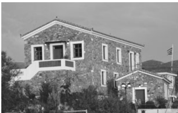
Το Μουσείο Δημοκρατίας.

πικά αντικείμενα εξορίστων, τεκμήρια της διαβίωσης στην εξορία, χαρακτηριστικά διοικητικά έγγραφα, βιβλία. Η έκθεση οργανώνεται γύρω από τους εξής θεματικούς άξονες: