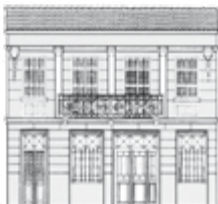
ICOM • ΕΛΛΗΝΙΚΟ ΤΜΗΜΑ

Η ετήσια συνδρομή θα πρέπει να καταβάλλεται το αργότερο μέχρι τις 15 Μαρτίου.