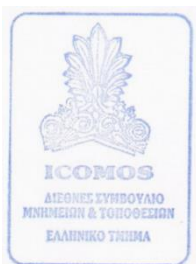
Δρ Αθανάσιος Νακάσης